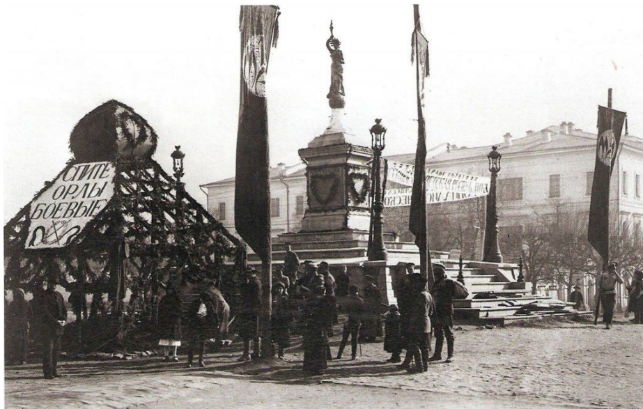
Мемориальный комплекс погибшим красноармейцам. весна 1918 года