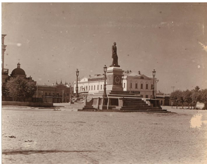
Рисунок 9. Кафедральный собор Рисунок 10.