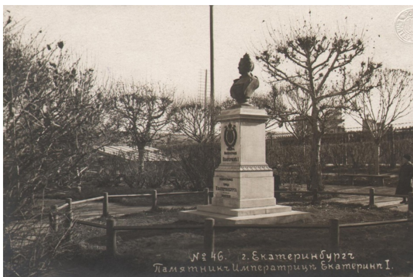
Рисунок 5. Бюст Екатерины Первой