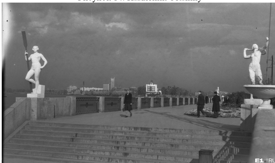
Рисунок 15. Скульптуры на набережной