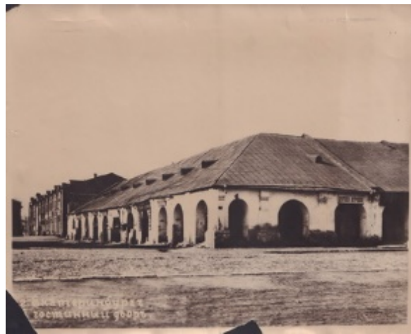
Рисунок 8. Гостиный двор