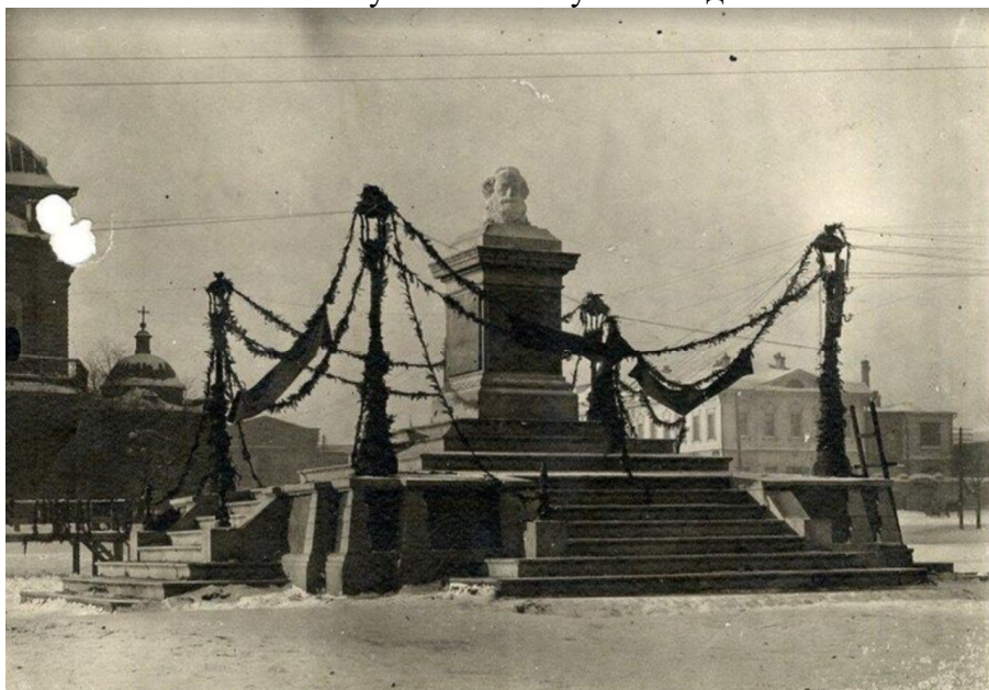
Рисунок 12. Бюст Карла Маркса