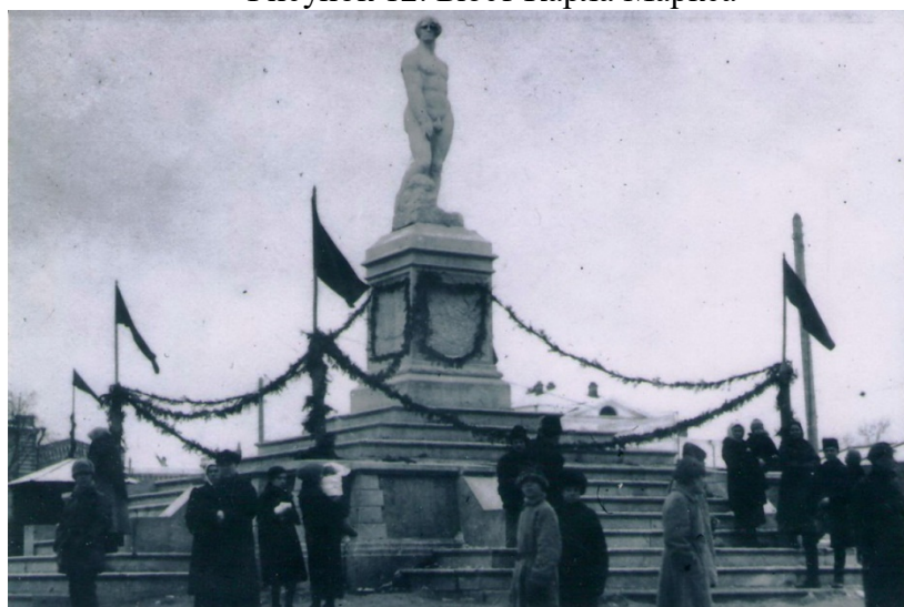
Рисунок 13. Освобожденный труд