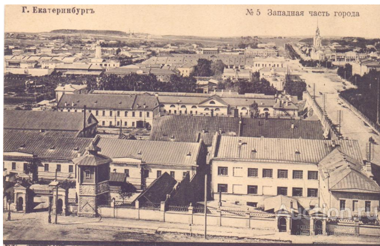
Рисунок 4. Крыши завода