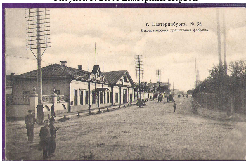
Рисунок 6. Фасад Гранитной фабрики