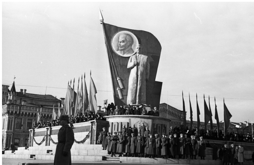
Рисунок 14. Памятник Сталину