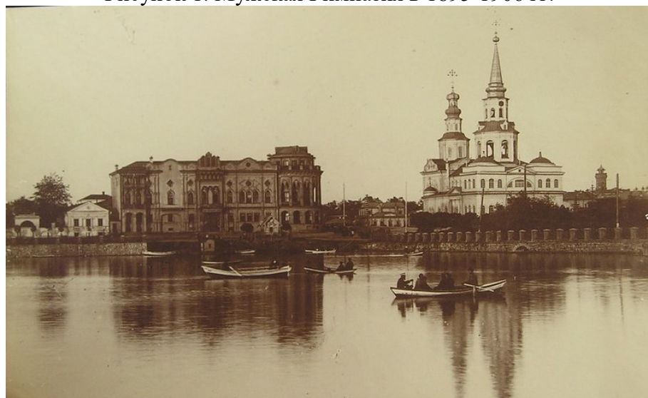
Рисунок 2. Тарасовская набережная