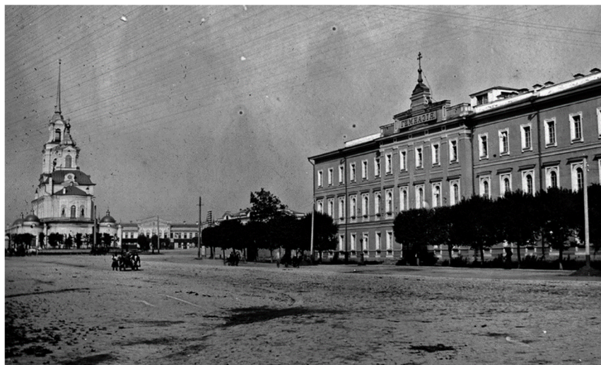
Рисунок 1. Мужская Гимназия в 1895-1906 гг.