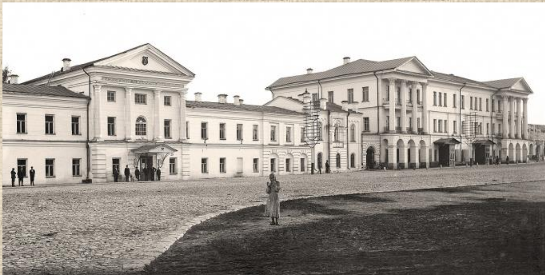
Горное училище и Уральское горное управление (справа) Вернуться к карте