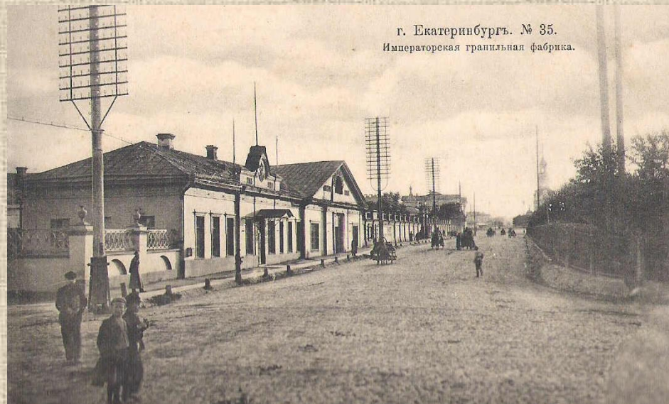
Императорская гранильная фабрика Вернуться к карте