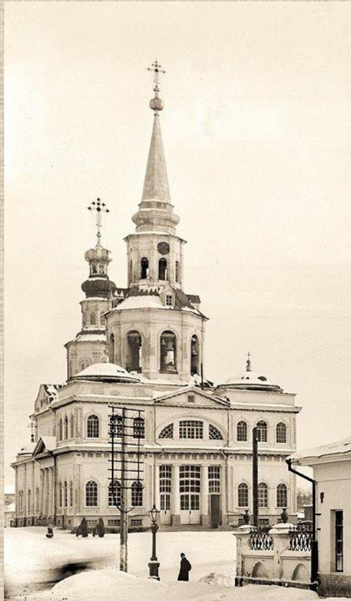
Екатерининский горный собор