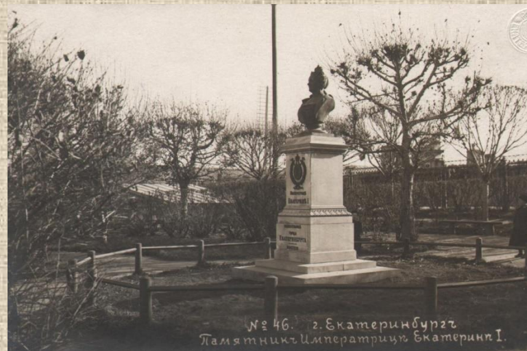
Бюст Петра I(7) и Екатерины I(8) Вернуться к карте