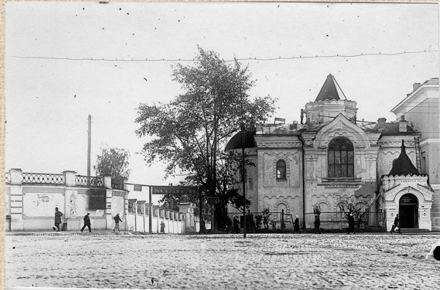
Афанасьевский домовый храм при Горном училище Вернуться к карте