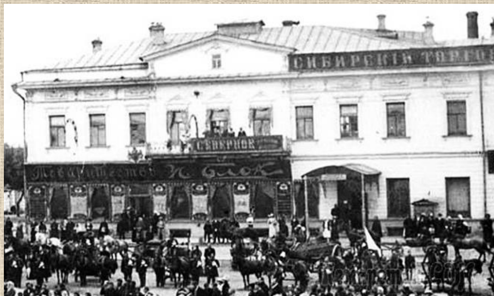
Сибирский Торговый банк