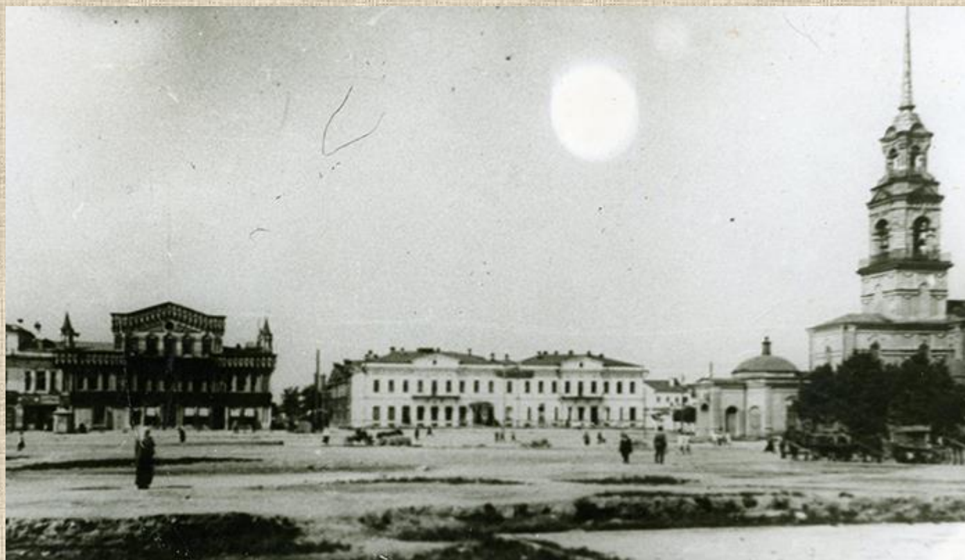
Кафедральная площадь. Слева направо: дома Коробковых, Сибирский банк, Богоявленский собор