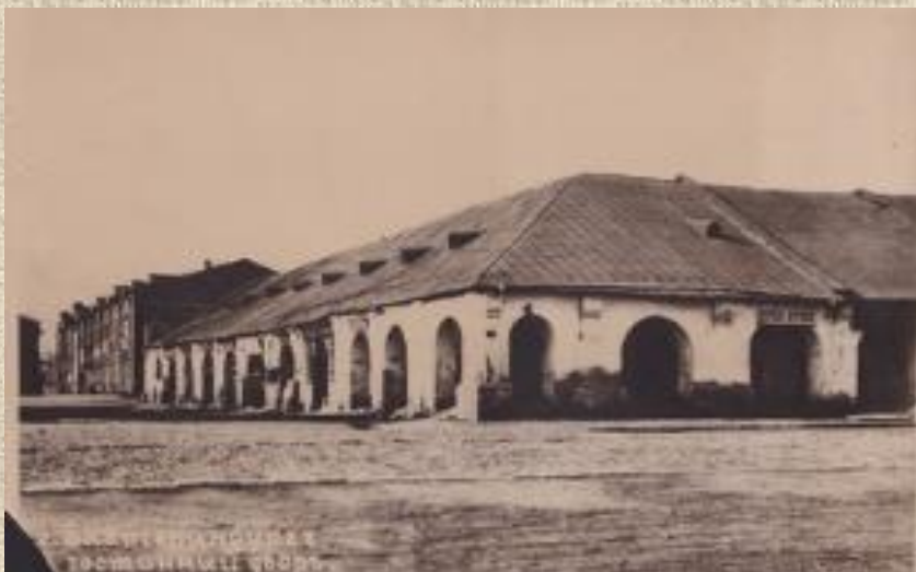
Гостиный двор Вернуться к карте