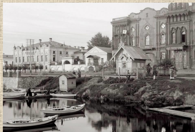
Тарасовская набережная и усадьба Тарасовых (слева) Вернуться к карте