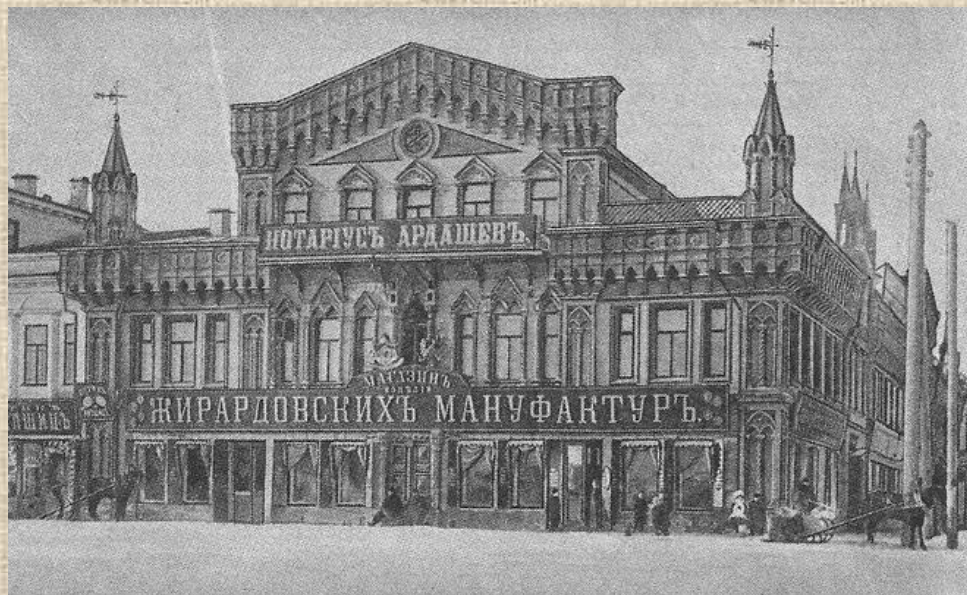
Дом Коробковых Вернуться к карте