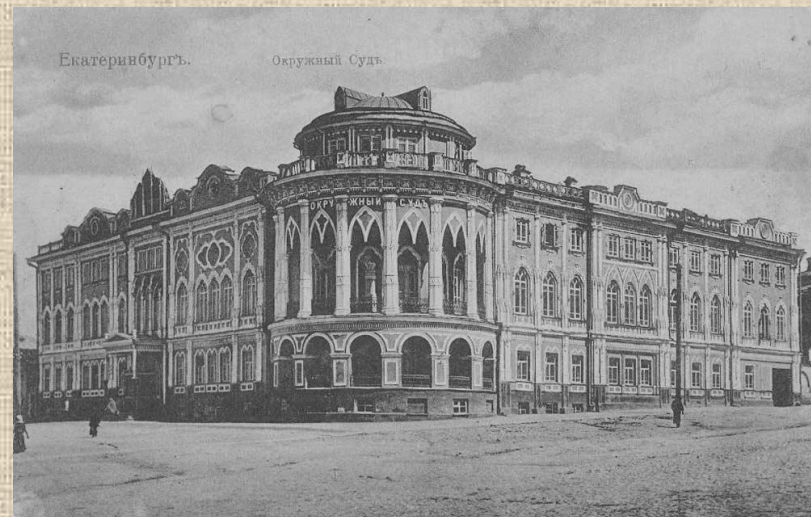
Дом Севастьянова Вернуться к карте