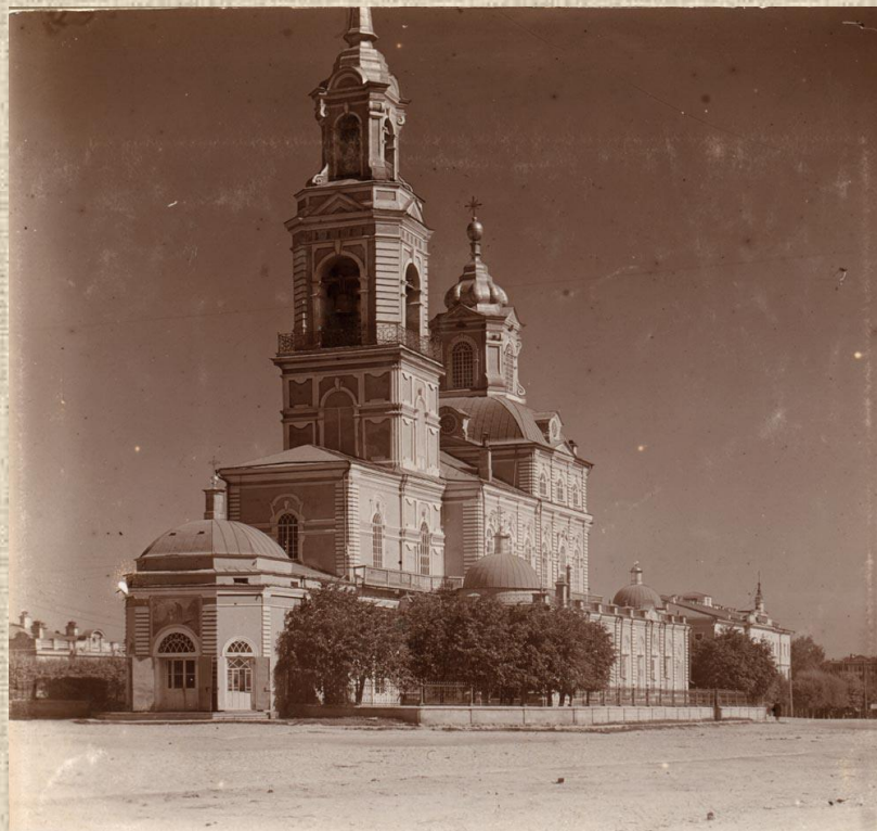
Кафедральный (Богоявленский) собор Вернуться к карте