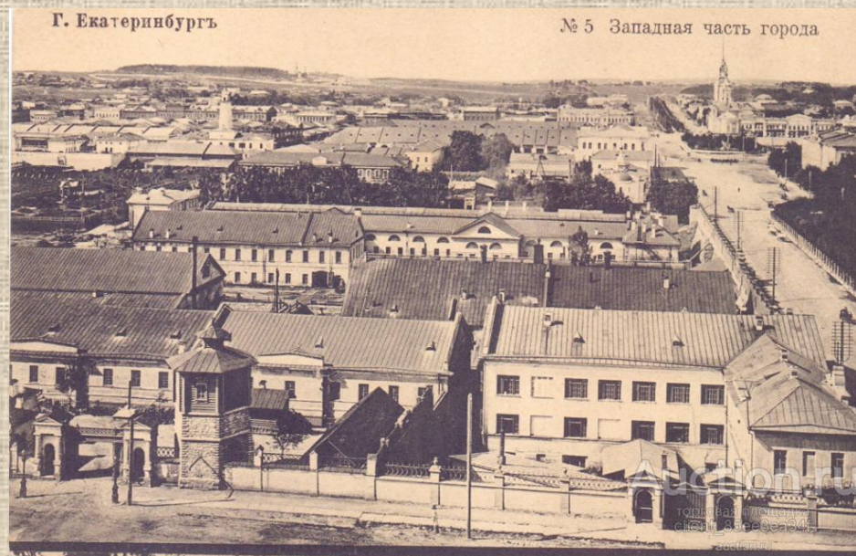
Екатеринбургский горный завод и Водонапорная башня(слева) Вернуться к карте